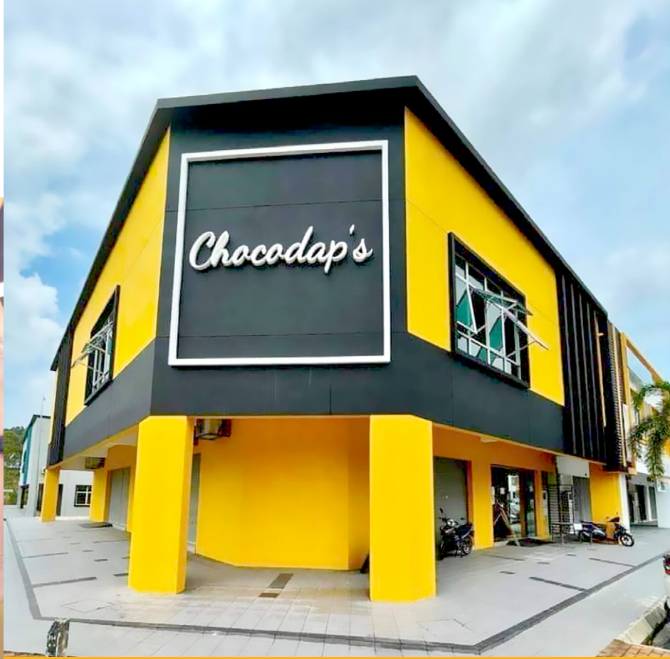
KILANG CHOCODAP'S DI SENDAYAN.

“Konflik itu memaksa kami berdua berpindah keluar dari rumah ibu bapa kerana kami nekad mahu meneruskan perjuangan menjalankan perniagaan tersebut. Segala-galanya hanya kami berdua yang uruskan.”