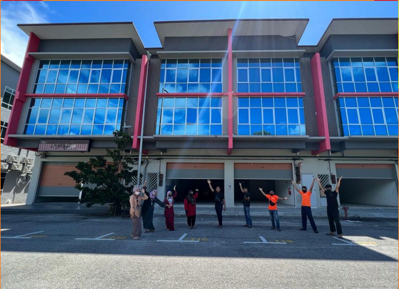
BERGAMBAR DIHADAPAN KILANG BARU MUIZ HOT CHICKEN.

“Ramai orang boleh buat pemasaran, tapi tak ramai orang yang boleh bina pasukan dan jadi pemimpin yang baik,” tegasnya.