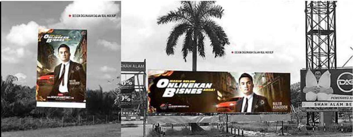
BILLBOARD MOMENTUM INTERNET KELIHATAN DI BEBERAPA LOKASI STRATEGIK DI NEGARA.

keyakinan diri, walaupun dalam masa yang sama, beliau mahu bertanggungjawab membantu meringankan kesusahan ibunya.